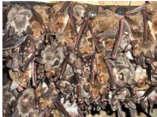
Essaim de Grands murins