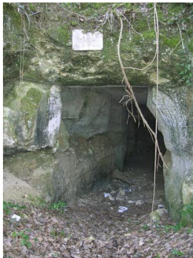
Une entrée de carrière souterraine

Le site Natura 2000 des « Carrières de Cénac » s'étend sur 22,6 ha sur la commune de Cénac exclusivement. Cette zone se situe au nord du lieu-dit Citon et à l'est de l'ancienne voie SNCF réhabilitée en piste cyclable.