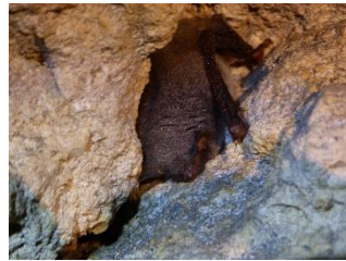
Murin de Daubenton