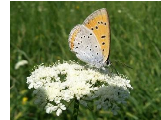
Le Cuivré des marais

La commune de Cénac est concernée par un second site Natura 2000 correspondant à la vallée alluviale de la Pimpine. Ces deux sites sont complémentaires notamment dans le cycle de vie des chauves-souris : l'un assure le gîte et l'autre le couvert. Mais la vallée alluviale de la Pimpine est aussi un milieu de vie pour de nombreuses autres espèces comme la Loutre d'Europe ou le Cuivré des marais.