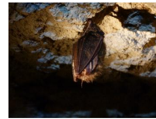
Oreillard en hibernation